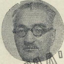
1892 1958 Kırkağaç Bergama